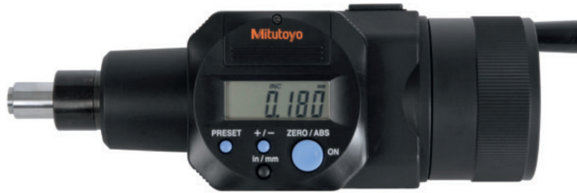
Digitales Anbaumikrometer, Bestell-Nr. 00-99-901-4889